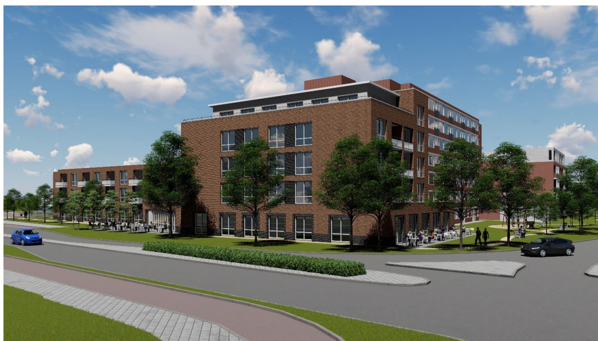
Impressie aanzicht Blok D

Om bovengenoemde activiteiten mogelijk te maken, zijn veel bomen en struiken verwijderd. Tot onze spijt zijn aan de Vechtensteinlaan zijde een aantal bomen gesneuveld die niet gekapt hadden mogen worden. Eerder vandaag is naar aanleiding daarvan in overleg met de gemeente gekeken naar een passende oplossing daarvoor. Wij hebben de toezegging inmiddels gedaan dat wij deze fout zullen herstellen. Aan de Dr. Plesmanlaan is aan de zijde van Merenhoef een regelmatig ritme van eikenbomen voorzien. Deze eikenbomen worden aan het einde van de bouwactiviteiten van fase 1 weer terug geplant.